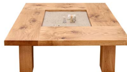
„Meditationstisch Sand“ Eichenholz - Sand Nr. 77702