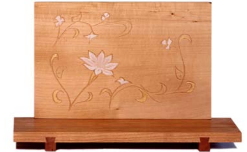
Altar „Blumenranke“ Kirschholz / Linde – Echtvergoldung Größe A · Nr. 33316