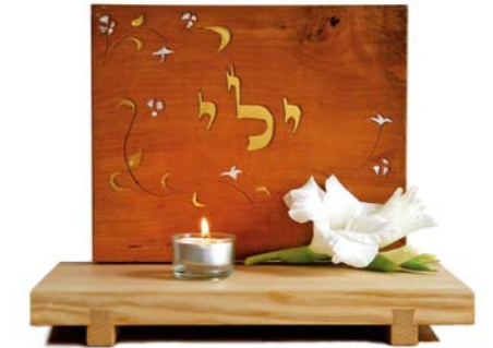
Altar „Funken Gottes zurück erobern“ Eschenholz / Birne – Echtvergoldung Größe A · Nr. 33312