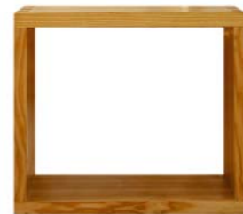
„Meditationquader“ Eschenholz Durch eine Nut und Kautschuk-Feder, können die Quader quer oder längs übereinandergestellt werden. Nr. 77701