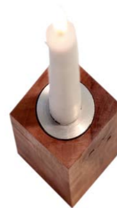
„Einsatz“ Edelstahl mit Bohrung · Nr. 44403