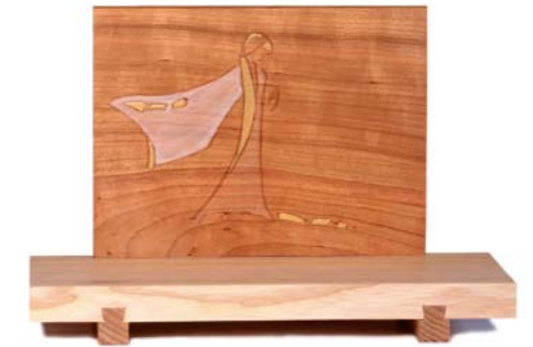
Altar „Gebet“ Eschenholz / Kirsche – Echtvergoldung Größe A · Nr. 33305