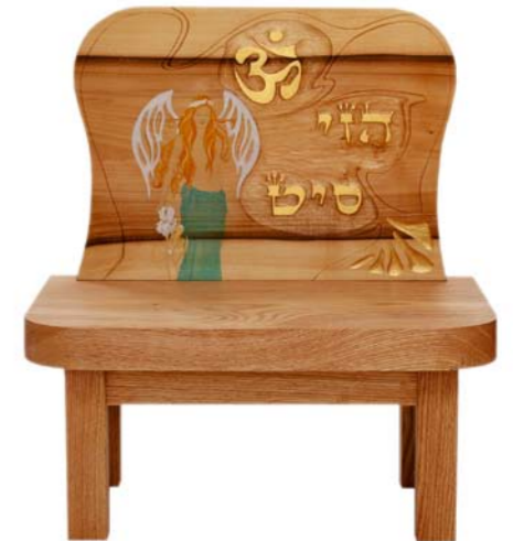
Bodenaltar „Om / Kabbalah: Einfluss der Engel, Wunder wirken“ Roteichenholz / Linde – Echtvergoldung Malerei Engel: Manou Zeise Größe C · Nr. 33303