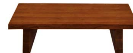
„Meditationstisch Morgenwind“ Kirschholz, FüÙe eingegratet Nr. 77703