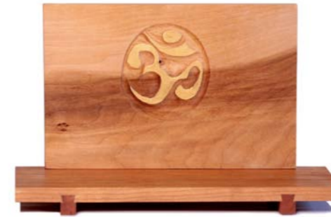
Altar „Om“ Kirschholz / Linde – Echtvergoldung Größe A · Nr. 33301

ist ein Symbol der Form, als auch des Kluges und bezeichnet die Gegenwart des Absoluten. Es gilt als das heiligste aller Mantras. OM auch AUM ist die Einheit der Dreiheit.