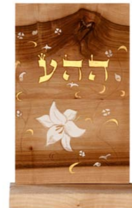
Altar „Bedingungslose Liebe“ Eschenholz / Linde – Echtvergoldung Größe B · Nr. 33313