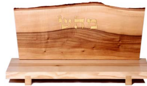
Altar „Heilen“ Eschenholz / Linde – Echtvergoldung Größe B · Nr. 33311

Es bedarf keiner Aussprache der Namen und auch keines Wissens über deren Wirkung. Sie brauchen nur von rechts nach links die Buchstaben zu betrachten (scannen), und in dieser einfachen Handlung werden spirituelle Kräfte freigesetzt.