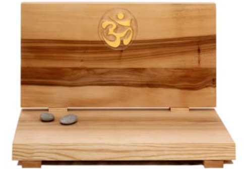
Altar „Om“ Eschenholz / Linde – Echtvergoldung Größe B · Nr. 33302