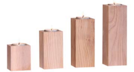
„Kerzenhalter hell“ Eschenholz weiß lasiert Größe 6 cm, 9 cm, 12 cm, 15 cm Nr. 44402