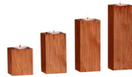
„Kerzenhalter“ Kirschholz Größe 6 cm, 9 cm, 12 cm, 15 cm Nr. 44401