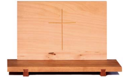
Altar „Kreuz“ Kirschholz / Linde – Echtvergoldung Größe A · Nr. 33308