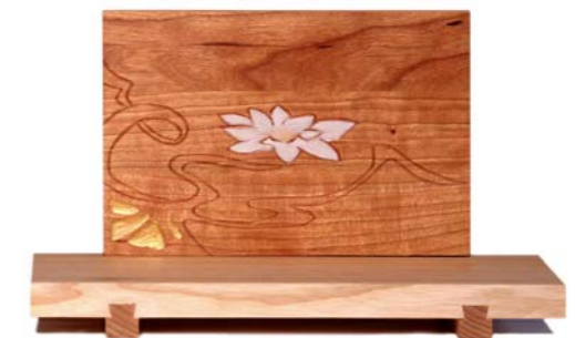
Altar „Seerose 2“ Eschenholz / Kirsche – Echtvergoldung Größe A · Nr. 33317