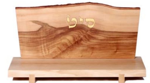
Altar „Wunder wirken“ Eschenholz / Linde – Echtvergoldung Größe B · Nr. 33314