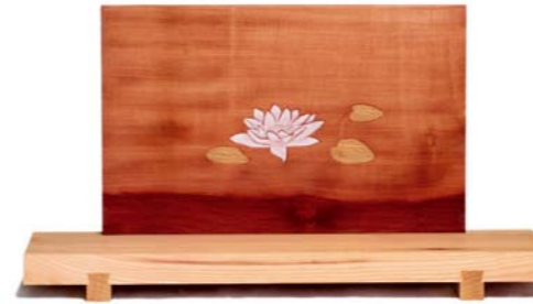
Altar „Seerose 1“ Eschenholz / Linde – Echtvergoldung Größe A · Nr. 33315