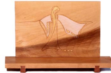
Altar „Segnung“ Kirschenholz / Linde – Echtvergoldung Größe A · Nr. 33304