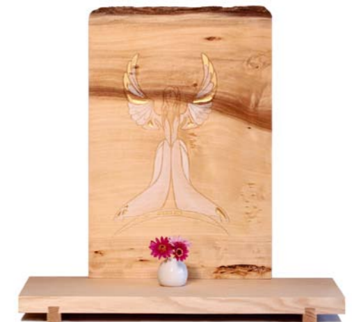
Altar „Begleiter“ Eschenholz / Linde – Echtvergoldung Größe B · Nr. 33306