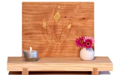
Altar „Dreifaltigkeit“ Eschenholz / Kirsche – Echtvergoldung Größe A · Nr. 33310