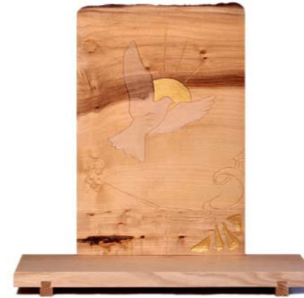
Altar „Heiliger Geist“ Eschenholz / Linde – Echtvergoldung Größe B · Nr. 33307