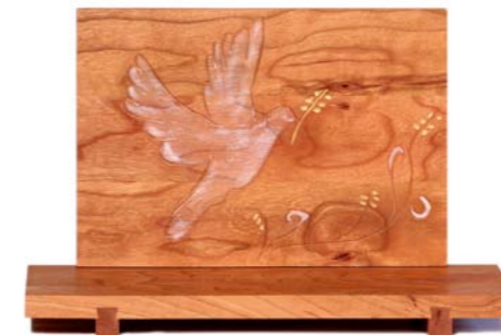
Altar „Frieden“ Kirschholz – Echtvergoldung Größe A · Nr. 33309